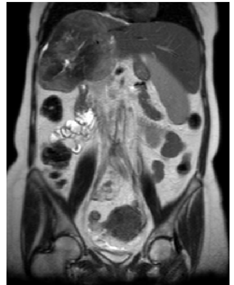
An MRI image of the abdomen.

An MRI scan of the abdomen (belly) usually involves taking at least 4 sets of pictures. Each set lasts 14 seconds to 4 minutes and will show a different area of your abdomen.